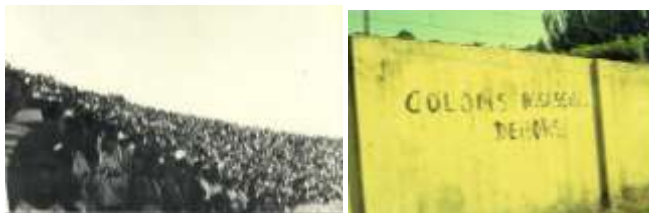
Meeting à l'université

Ce que m'a appris ce premier mouvement social hors de France c'est que le déclencheur des crises est souvent imprévisible parce que les logiques souterraines des crises qui amènent à une explosion sont bien souvent invisibles. La crise est la résultante d'un effet de situation, d'un effet d'acteurs et d'un effet de structure, dont chaque effet est difficile à pondérer. Tout cela peut s'observer par l'image et l'interview utilisées comme des indices descriptifs des crises.