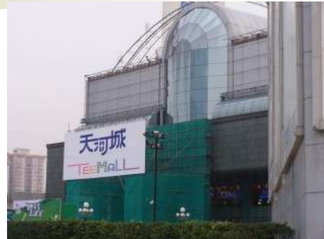
Teemall, district de Tianhe, 2003.