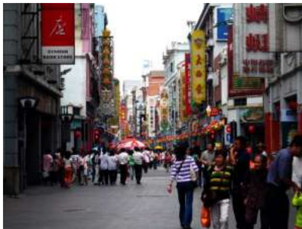
Rue Shanxiajiu, district de Liwan, 2004.