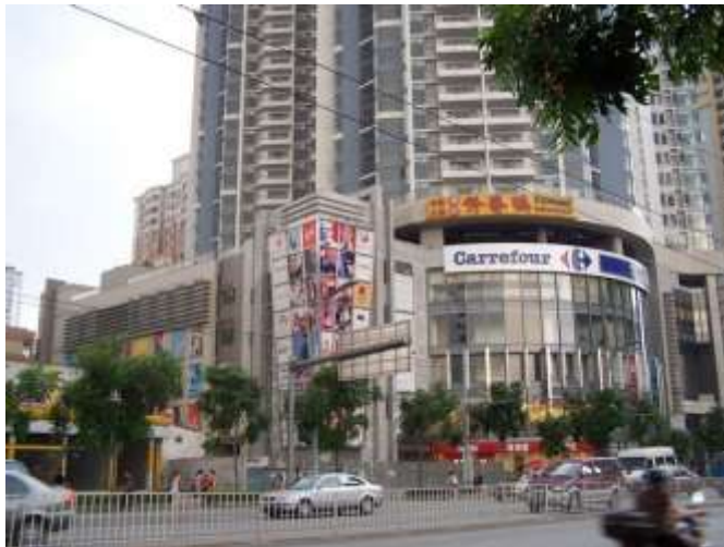
Carrefour, district de Liwan, 2004.