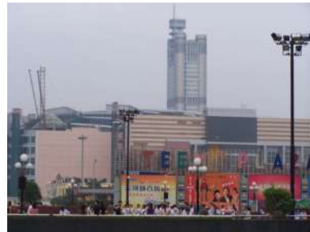
District de Tianhe, 2004.