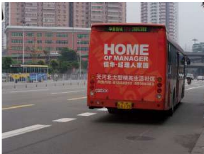
Publicité pour une résidence située dans le district de Tianhe, 2003.