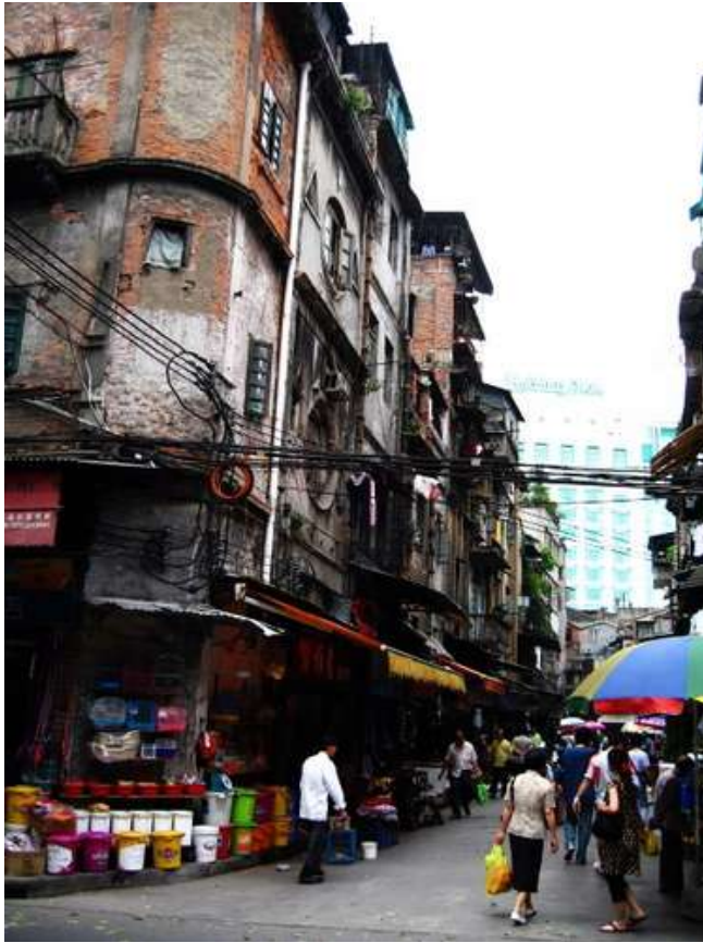
Marché de la rue Qing Ping, quartier de Liwan. 2005