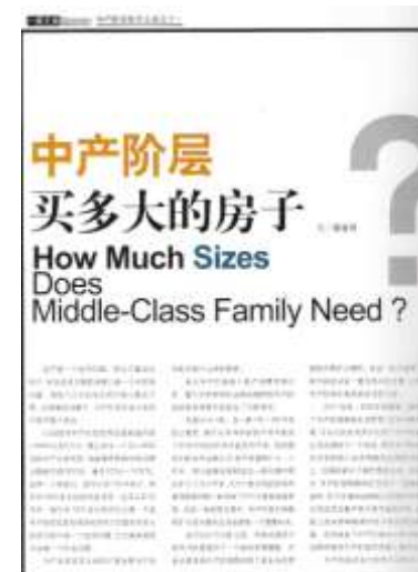
Article du magazine Trendshome, 2004.