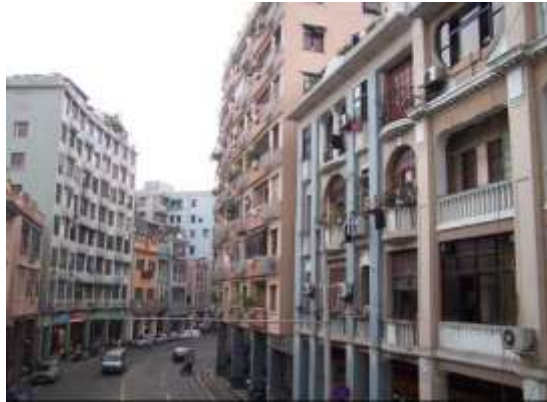
Carrefour avec la rue de Pékin, district de Yuexiu, 2001.