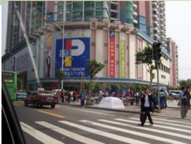
Parkn'shop, district de Haizhu, 2004.