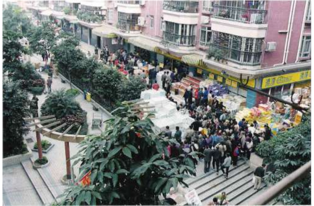
Supérette. District de Yuexiu. 2003