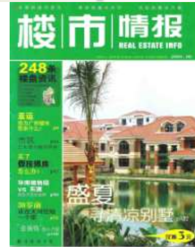
La couverture du magazine Real Estate Info, 2004.