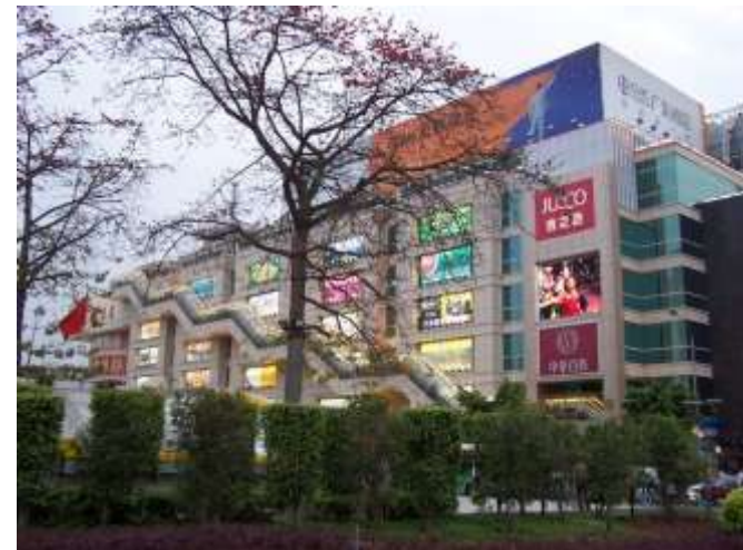
China Plaza, District de Dongshan, 2003.