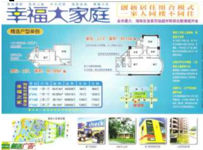
Publicité pour une résidence, district de Haizhu, 2003.