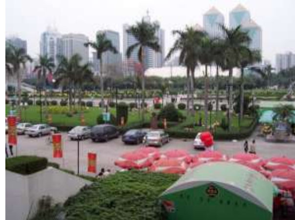
District de Tianhe, 2004.