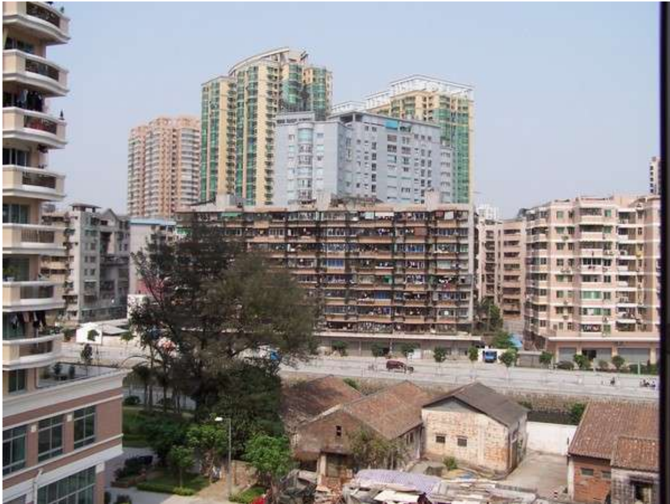
Résidences, district de Haizhu 2003.